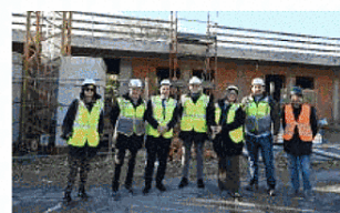
Il sopralluogo al cantiere di via Corridoni

Centro accoglienza di via Corridoni. Lavori conclusi per la primavera