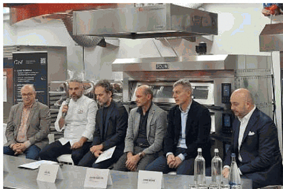
Presentazione Il progetto è stato descritto ieri nella sede di Cast Alimenti

Si tratta di un'iniziativa internazionale che punta alla realizzazione del treno di cioccolato più lungo del mondo: un'opera di 52 metri e dal peso di 23 quintali, che verrà esposta dal 25 al 27 gennaio prossimi a Milano, all'interno di Palazzo Lombardia. Sorto dall'unione d'intenti tra le eccellenze pasticciere italiane e maltesi in vista delle prossime Olimpiadi invernali di Milano Cortina 2026, Winter Games Express vuole andare al di là della pur lusinghiera gloria del Guinness